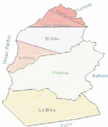
Ilustración: Dirección Política de la Provincia de Talara

El distrito de La Brea fue creado mediante Ley N° 7627 del 31 de octubre de 1932,2 en el gobierno del Presidente Luis Miguel Sánchez Cerro. El distrito tiene una superficie de 692,96 km². El Distrito La Brea - Negritos es uno de los seis distritos de la Provincia de Talara, ubicada en el Departamento de Piura y bajo la administración del Gobierno regional de Piura, en el norte del Perú.